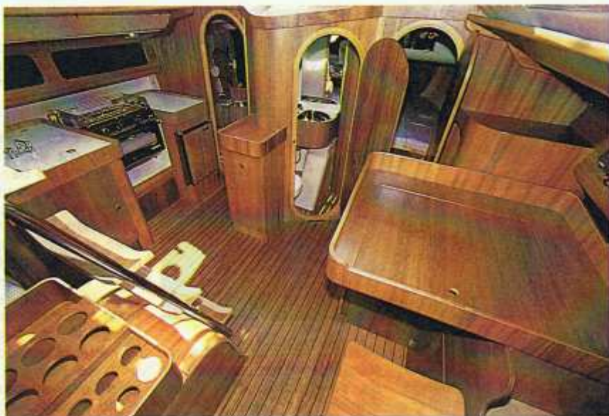
Espace et lumière sont les points forts des aménagements du Kelt 11,50 m. Si la disposition de la cuisine et de la table à cartes est classique, de part et d'autre de la descente, celle du carré et de la couchette double, sous le cockpit, sort des sentiers battus.

Prix : 650 000 F environ lors du lancement au Grand Pavois.