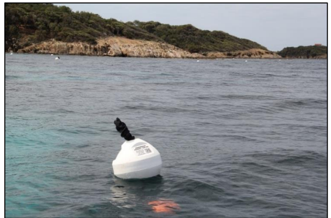
Exemple de Bouées avec indications : celles de la ZMEL de Bagaud